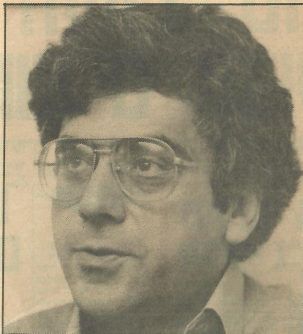
ד"ר סרי נוסייבה

— מאת בינה ברזל ויצחק רביחיא, כתבי "דיעות אחרונות" —